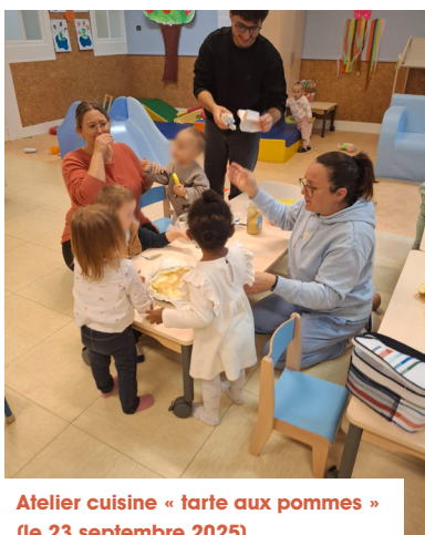
Atelier cuisine « tarte aux pommes » (le 23 septembre 2025)