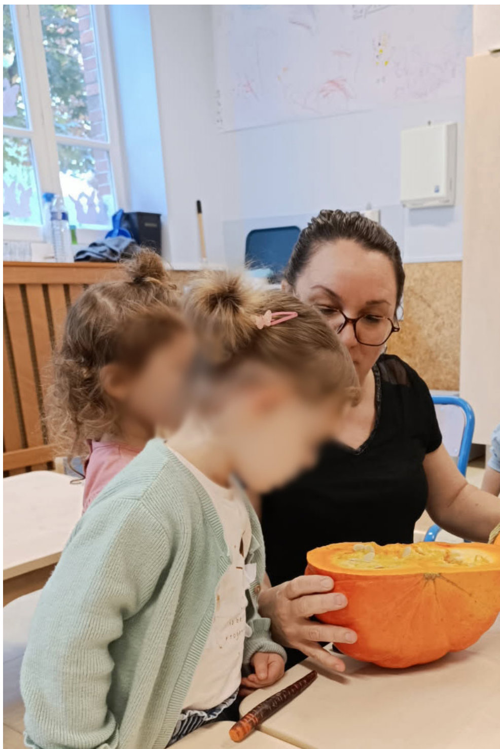
Semaine du goût avec un atelier « soupe » (le 14 octobre 2025)