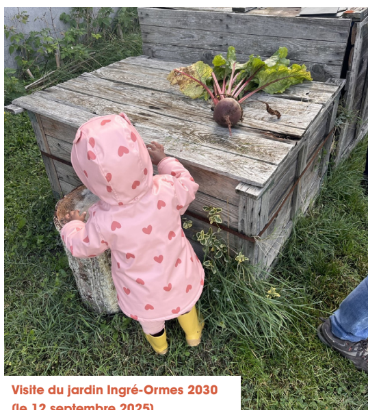
Visite du jardin Ingré-Ormes 2030 (le 12 septembre 2025)