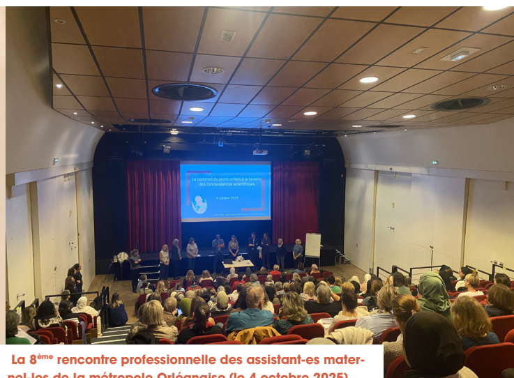
La 8 ème rencontre professionnelle des assistant-es maternelles de la métropole Orléanaise (le 4 octobre 2025)