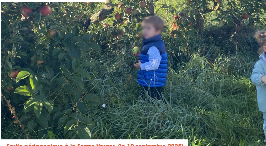
Sortie pédagogique à la Ferme Verger (le 19 septembre 2025)