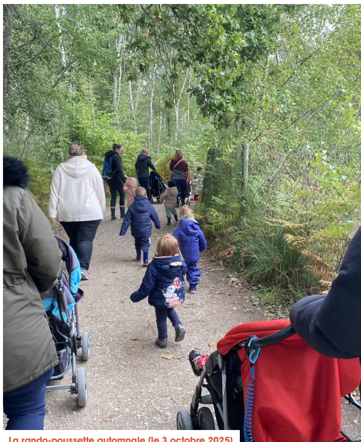
La rando-poussette automnale (le 3 octobre 2025)