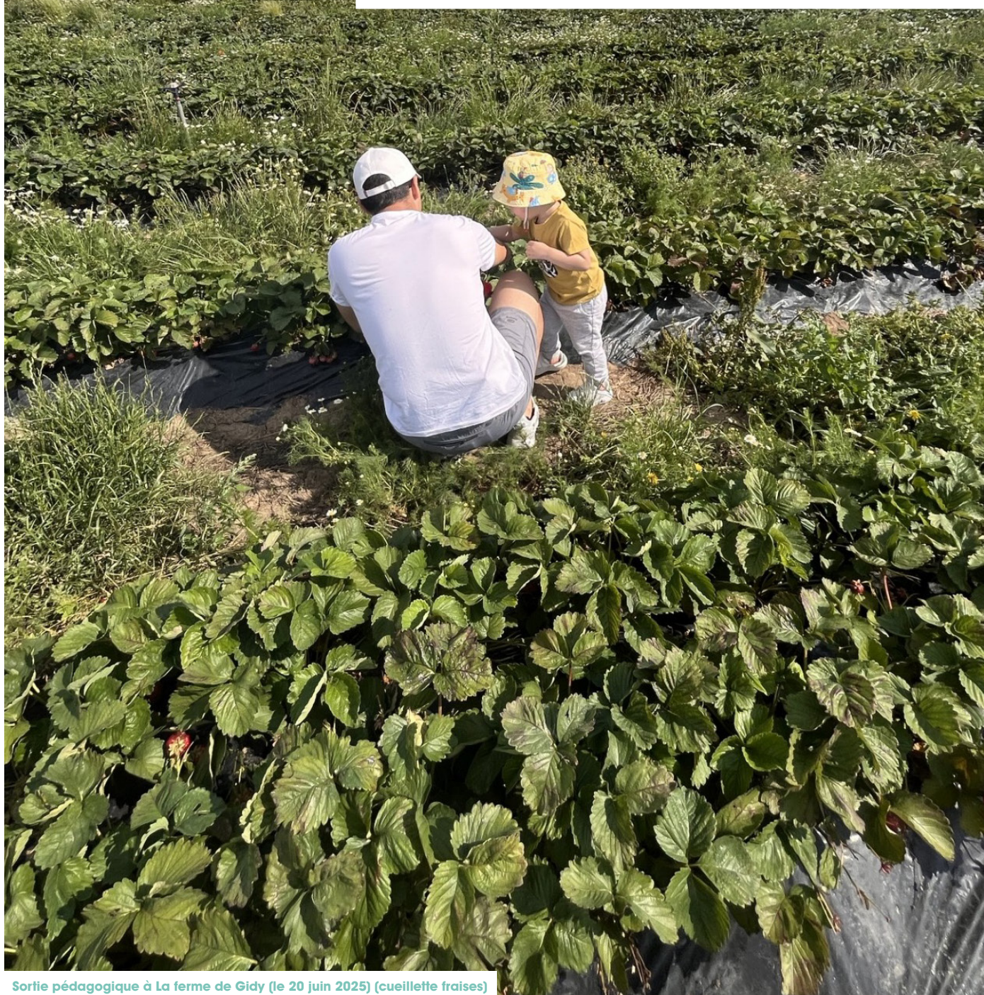
Sortie pédagogique à La ferme de Gidy (le 20 juin 2025) (cueillette fraises)