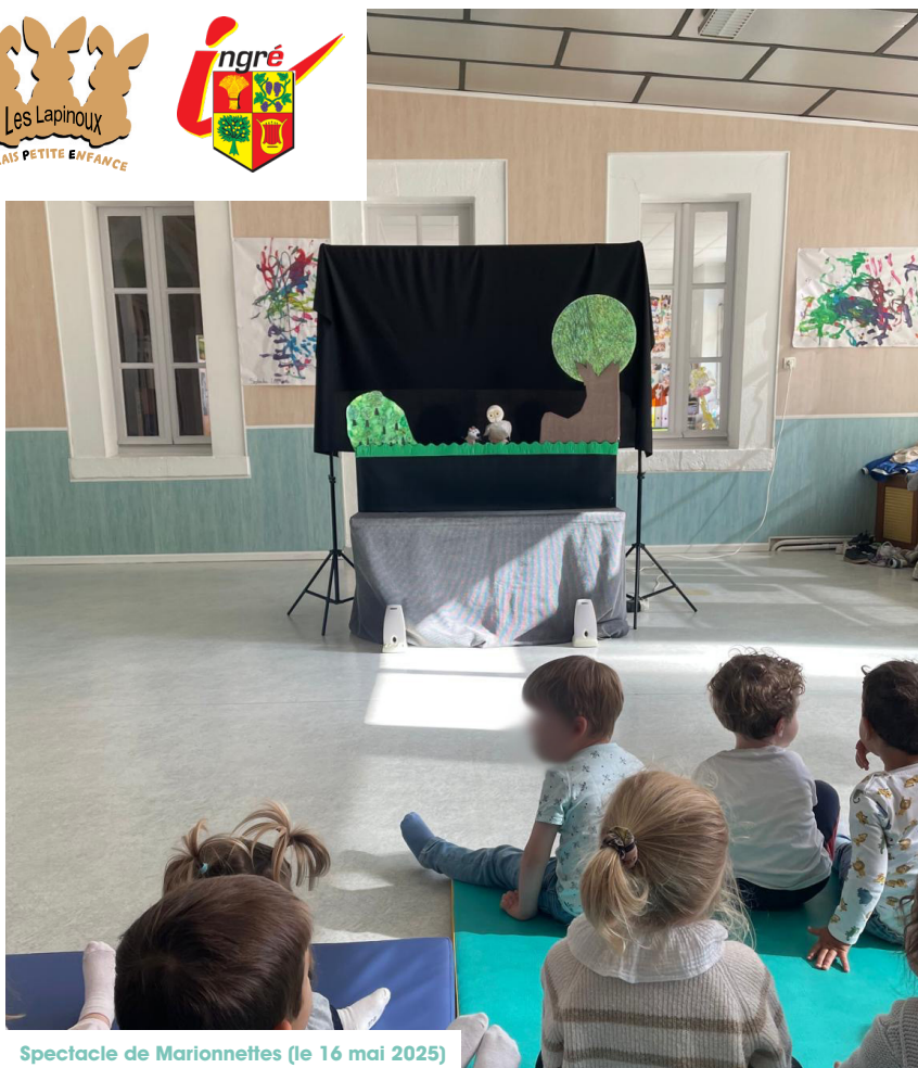
Spectacle de Marionnettes (le 16 mai 2025)