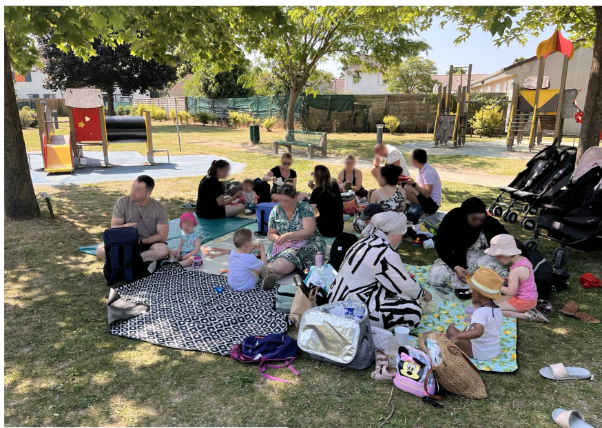
Pique-nique parc d'Ormes (le 13 juin 2025)