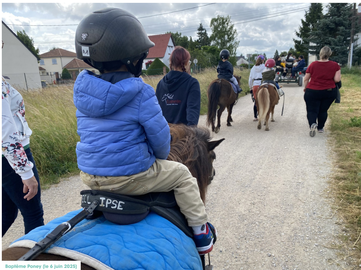
Baptême Poney (le 6 juin 2025)