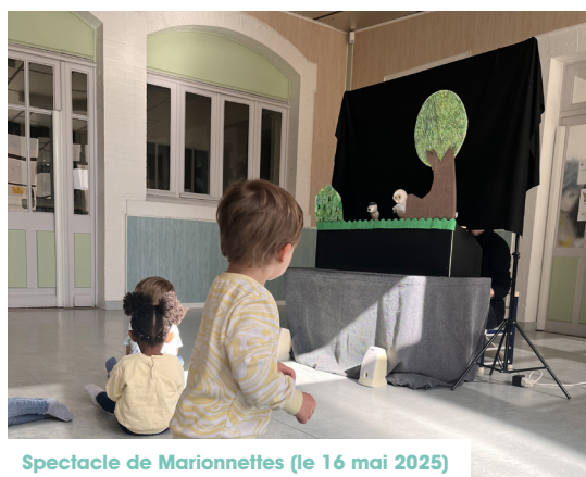
Spectacle de Marionnettes (le 16 mai 2025)