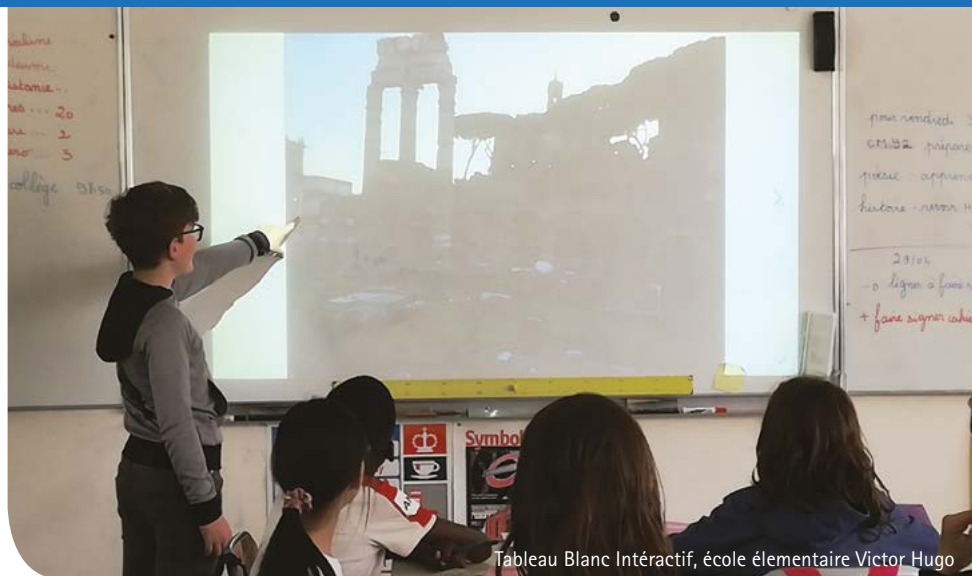
Tableau Blanc Interactif, école élémentaire Victor Hugo