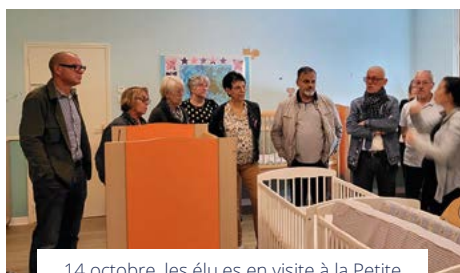
14 octobre, les élu.es en visite à la Petite Crèche quelques jours après son ouverture en septembre. Elle accueille des enfants 5 jours par semaine.