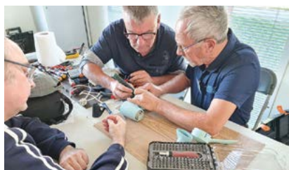
Tous les premiers samedis du mois, les bénévoles du Repair café redonnent vie à du petit électro-ménager.