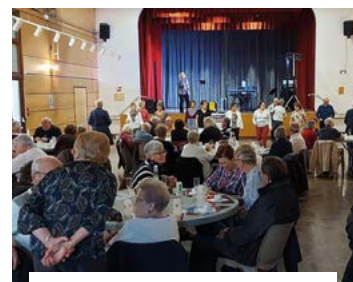
3 octobre, la semaine bleue est devenue le MOIS BLEU à Ingré pour les séniors !