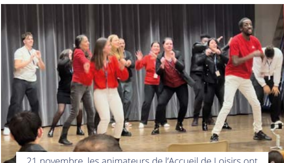
21 novembre, les animateurs de l'Accueil de Loisirs ont célébré les droits de l'enfant à la salle des Fêtes sur le thème « Casi'kids ». Parents et enfants ont apprécié cette soirée en deux temps : jeux et spectacle.