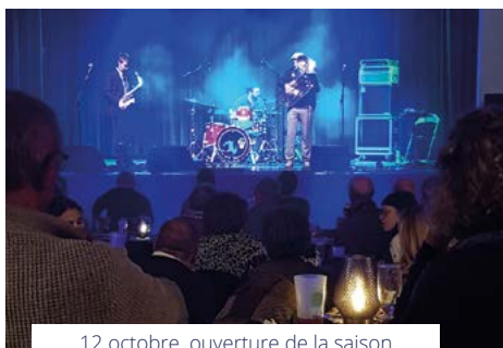
12 octobre, ouverture de la saison culturelle avec le concert du trio MadCheetah et sa musique Rock-World-Balkanique.