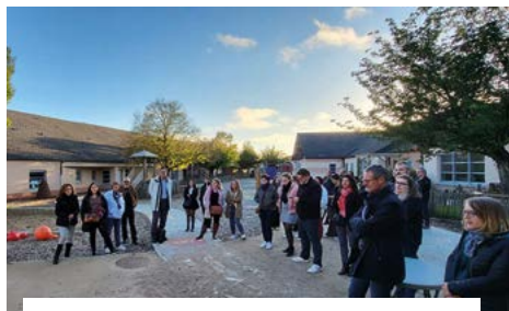
1 er octobre, accueil des nouveaux enseignants au Groupe Scolaire du Moulin.