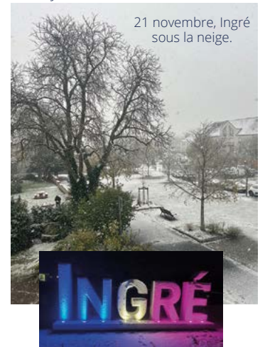
21 novembre, Ingré sous la neige.