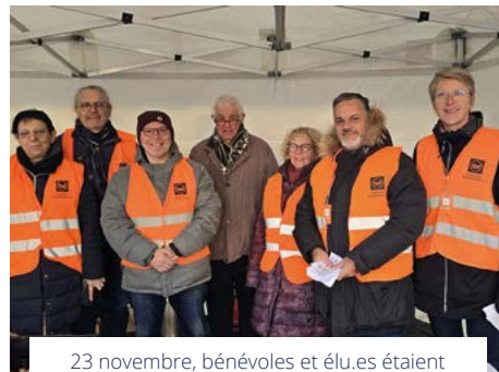
23 novembre, bénévoles et élu.es étaient présents sur le parking de Carrefour Market pour la campagne 2024 de la Banque alimentaire.