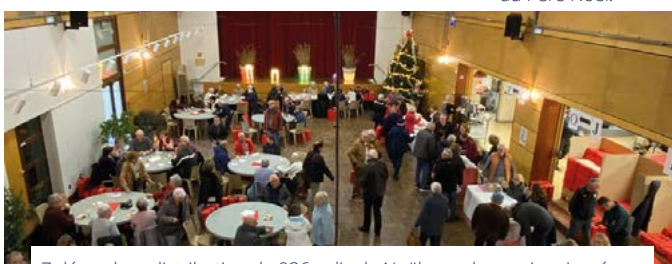
7 décembre, distribution de 936 colis de Noël pour les seniors ingrèens.

Retrouvez les photos sur facebook : ville d'Ingré