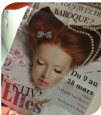
Édition 2015

20 mars - 20h : « Elles avant Nous » par la compagnie Grenier Neuf - La Passerelle (Fleury-les-Aubrais)