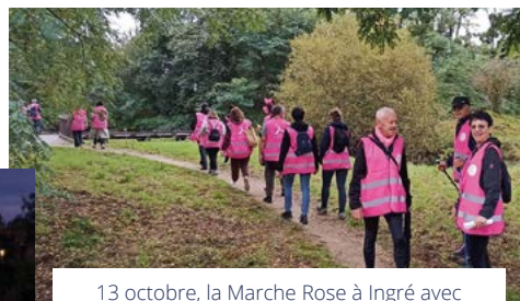
13 octobre, la Marche Rose à Ingré avec nos amis de St Jean de la Ruelle et de La Chapelle Saint-Mesmin.