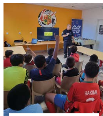
30 octobre, la Police Municipale explique la bonne utilisation des trotinettes aux jeunes du FCMI.