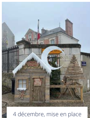
4 décembre, mise en place du service de courrier du Père Noël.