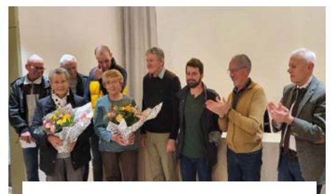
15 novembre, remise des prix des maisons fleuries.