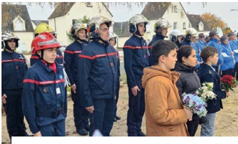
11 novembre, 106 e anniversaire de l'Armistice de la Première Guerre mondiale.