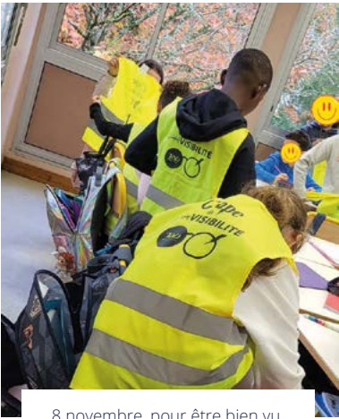
8 novembre, pour être bien vu, distribution des capes de visibilité de la Métropole aux élèves de CM2 d'Ingré.