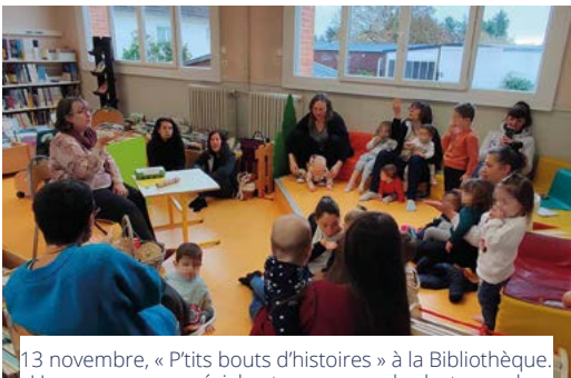
13 novembre, « P'tits bouts d'histoires » à la Bibliothèque. Un programme spécial automne avec des lectures, des comptines, des marrons et des feuilles mortes.