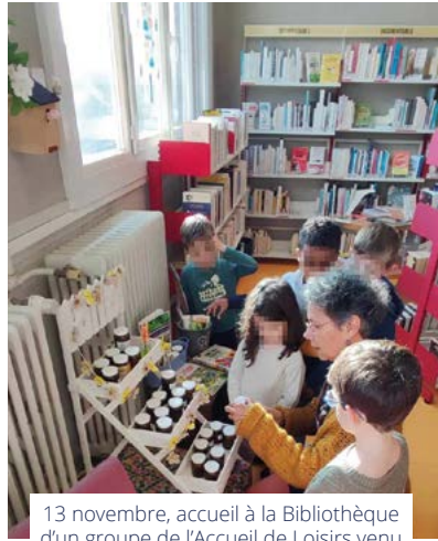
13 novembre, accueil à la Bibliothèque d'un groupe de l'Accueil de Loisirs venu profiter de la grainothèque.