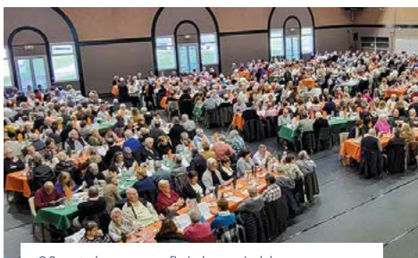
20 octobre, pour finir le mois bleu, repas en musique au gymnase de la Coudraye pour presque 500 seniors.