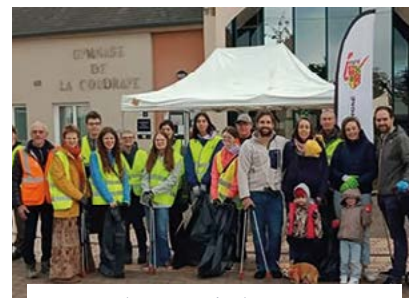
12 octobre, matinée de « ramassage citoyens » avec la participation d'une vingtaine d'Ingréennes et d'Ingréens.