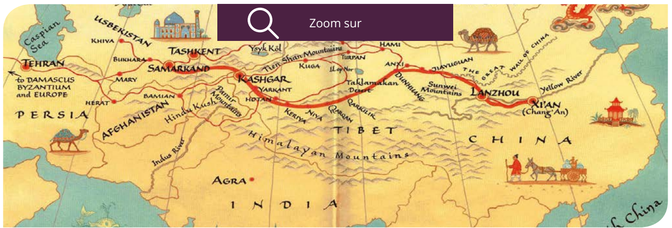
Carte ancienne de la Route de la Soie