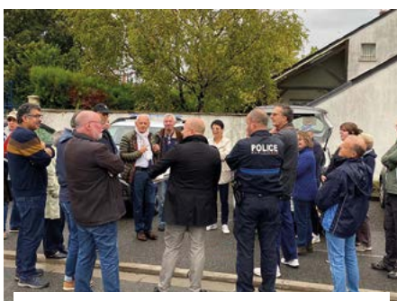
28 septembre, réunion de quartier. Les élu.es, accompagnés des services à la rencontre des habitants.