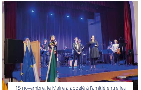
15 novembre, le Maire a appelé à l'amitié entre les peuples durant son discours de la Fête des Villes Jumelles.