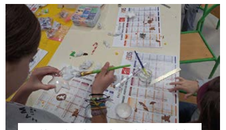
4 décembre, les enfants de l'Accueil de Loisirs préparent les fêtes de fin d'année.