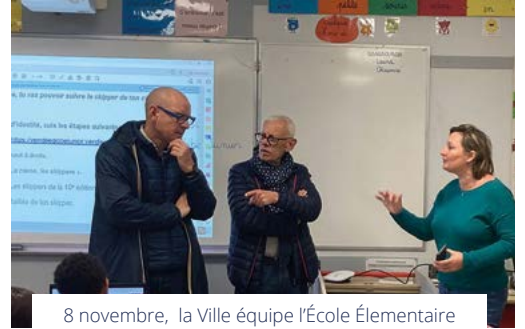
8 novembre, la Ville équipe l'École Élémentaire du Moulin d'un équipement numérique mobile.