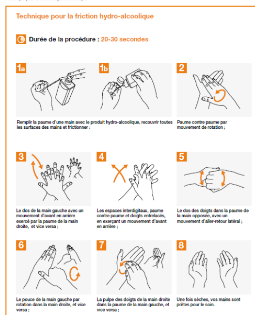
Figure II.1 Technique pour la friction hydro-alcoolique